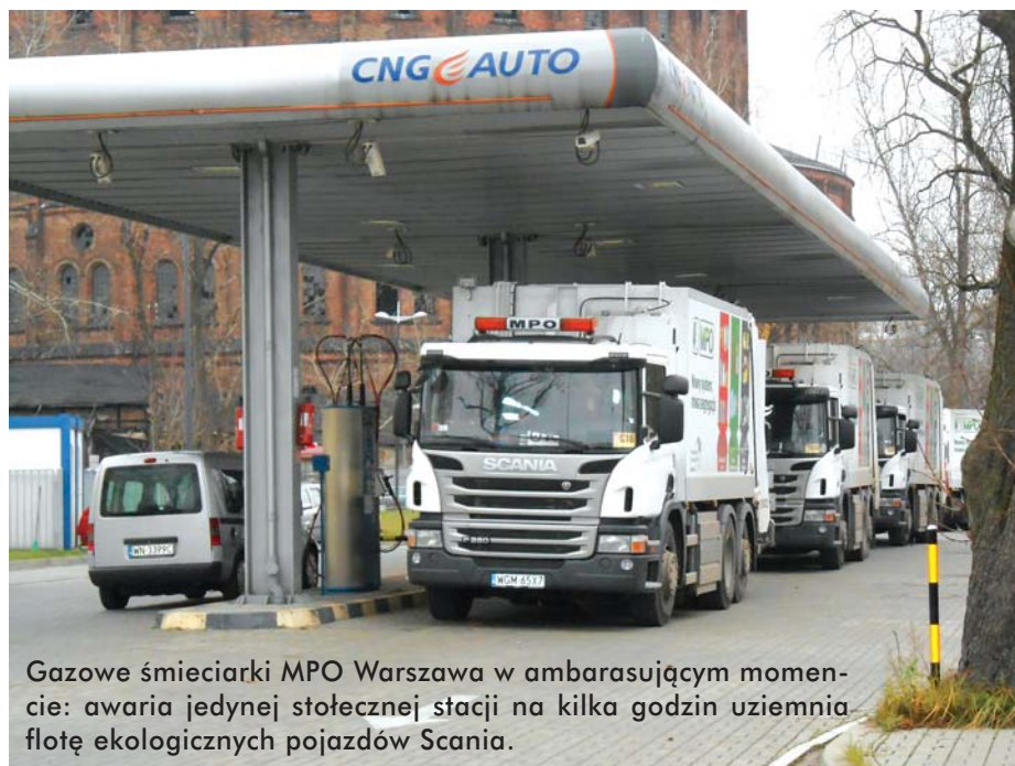
Gazowe śmieciarki MPO Warszawa w ambarasującym momencie: awaria jedynej stołecznej stacji na kilka godzin uziemia flotę ekologicznych pojazdów Scania.

Wspomniany strach przed nową technologią silnikową był tylko częściowo uzasadniony. Spowodowała ona wzrost ceny pojazdów o pokaźne kilka tys. euro, czego nie skompensowały żadne obniżki opłat drogowych. Okazało się jednak, że wbrew początkowym obawom nowe silniki Euro VI są równie niezawodne jak Euro V, a wyposażone w nie pojazdy są znacznie oszczędniejsze. Polscy przewoźnicy uzyskali średnio 13-% zmniejszenie zużycia paliwa, niemal 2-krotnie lepszy wynik niż przeciętna Scanii w Europie! Składają się na to nowe silniki 410 KM, spalające najmniej w historii firmy i nawet po dodaniu 6-7% tańszego AdBlue pozostające mistrzami gospodarności. Ta odrobina paliwa, tj. ok. 25 l/100 km w zestawie, jest spalana w bardzo prosty sposób: bez EGR, z turbosprężarką o stałym przepływie, maksymalnie niezawodnie i przy najdłuższych możliwych przebiegach między wymianami oleju. To także kwestia stosowania zautomatyzowanych skrzyń biegów z oszczędnościowym oprogramowaniem, uwzględniającym topografię terenu dzięki tempomatorowi Active Prediction, i ograniczającym maksymalną prędkość. Do tego, powszechnie przyjęł się telematyczny nadzór nad spalaniem i stylem jazdy kie-